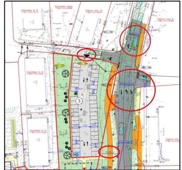
Joonis 1. Väljavõte projekti liikluskorralduse joonisest ja planeeringu põhijoonisest