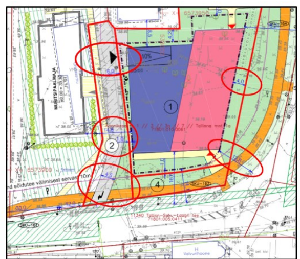
Joonis 2. Väljavõte projekti liikluskorralduse joonisest ja planeeringu põhijoonisest

Lisaks juhime tähelepanu, et joonisele on kandmata riigiteede nähtavuskolmnurgad vastavalt juhendile „ Ristmike vahekauguste ja nähtavusalade määramine “.